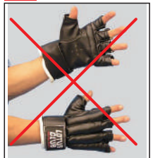
①ロータスクラブ製各種グローブ