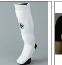
②グラチャン指定足サポーター