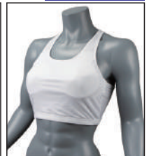
③イサミ製イサミスポーツブラ