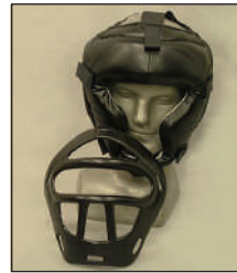
④各メーカーの面付きヘッドギアも面を外せば使用可能