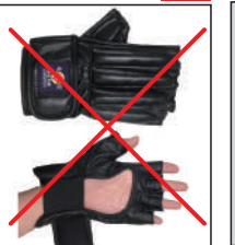
②グラチャン指定グローブ