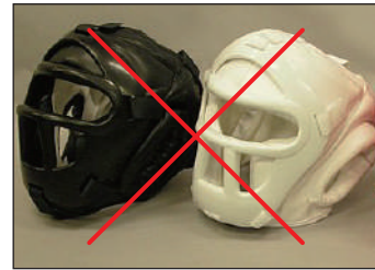
①ロータスクラブ製KEN スポーツ製面付きヘッドガード