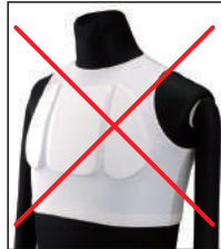
①リアルチャンピオン指定チェストプロテクター