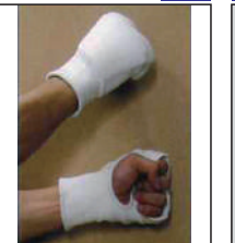
②KEN スポーツ製拳サポーター