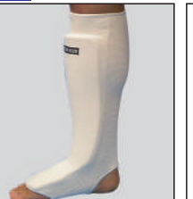
①ロータスクラブ製サポーターレッグ