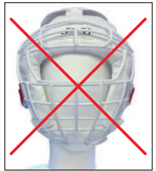
②マーシャルワールド製イサミ製面付きヘッドギア