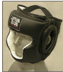
③ロータスクラブ製KEN スポーツ製レザー製ヘッドギア