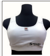
②グラチャン指定チェストガード