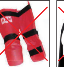
②KEN スポーツ製レッグパッド