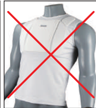
②イサミ製インナーチェスト