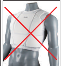
③イサミ製インナーベスト