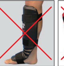
①ロータスクラブ製レザーレッグ