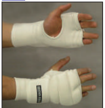
①ロータスクラブ製拳サポーター