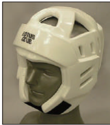
①ロータスクラブ製ウレタンヘッドガード