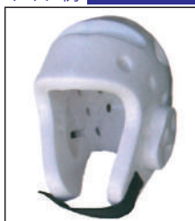
②KEN スポーツ製 ウレタンヘッドギア