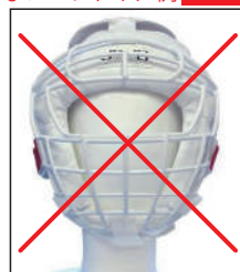
②マーシャルワールド製 イサミ製 面付きヘッドギア