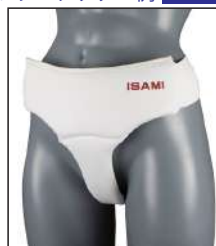
②女性用 アンダーガード