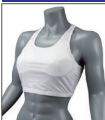
③イサミ製 イサミスポーツブラ