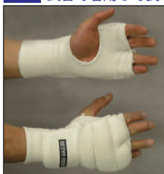
①ロータスクラブ製 拳サポーター