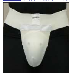
①男性用 金的カップ