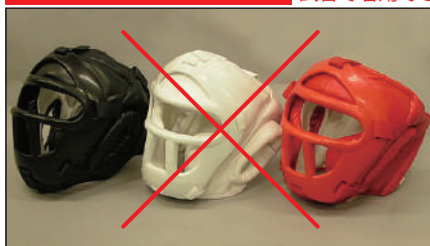
①ロータスクラブ製 KEN スポーツ製 面付きヘッドガード