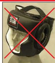
②ロータスクラブ製 KEN スポーツ製 レザー製ヘッドギア