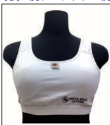
②グラチャン指定 チェストガード