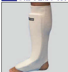
①ロータスクラブ製 サポーターレッグ