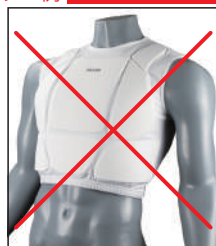
③イサミ製 インナーベスト