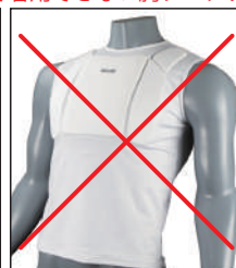
②イサミ製 インナーチェスト