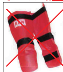
②KEN スポーツ製 レッグパッド