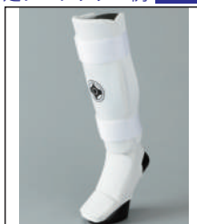
②グラチャン指定 足サポーター