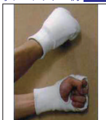
②KEN スポーツ製 拳サポーター