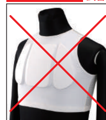
①リアルチャンピオン 指定チェストプロテクター