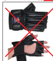
②グラチャン指定 グローブ