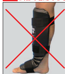
①ロータスクラブ製 レザーレッグ