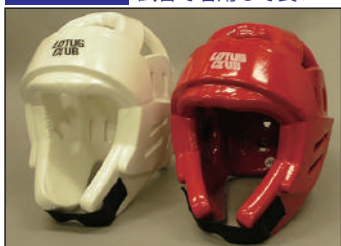
①ロータスクラブ製 ウレタンヘッドガード