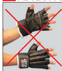
①ロータスクラブ製 各種グローブ